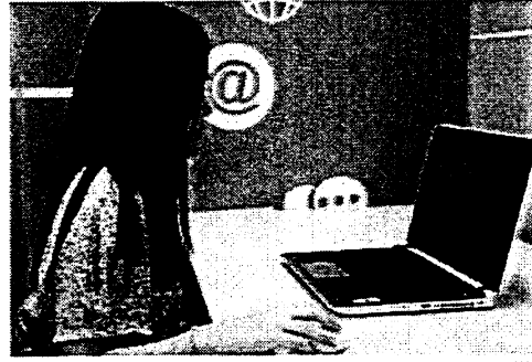
ภาพที่แสดงใน Meet ระหว่างคอมพิวเตอร์และผู้เข้าสอบ